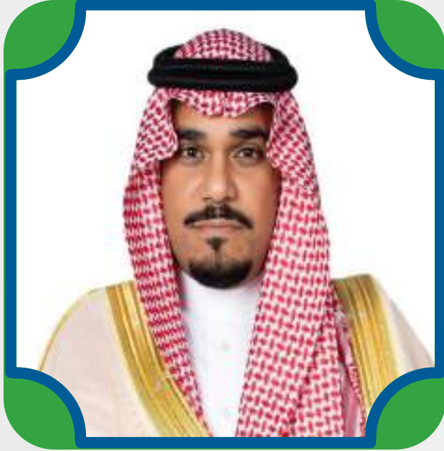
صاحب السمو الملكي الأمير تركي بن هذلول بن عبد العزيز نائب أمير منطقة نجران