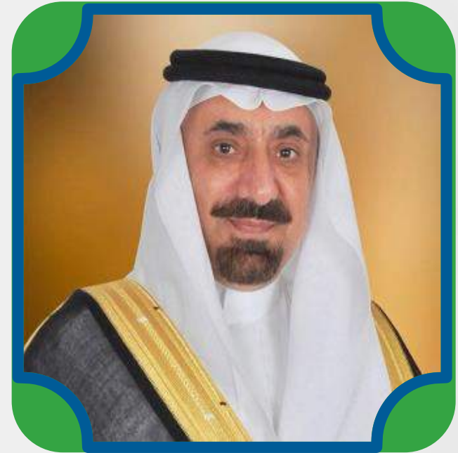
صاحب السمو الأمير جلوي بن عبد العزيز بن مساعد أمير منطقة نجران